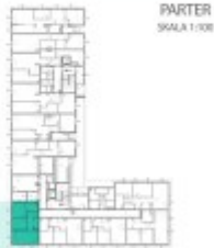
PARTER SKALA 1:100