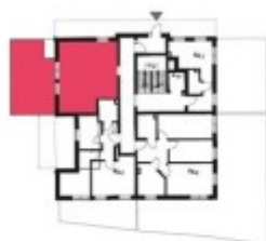
Schemat budynku klatka A PARTER