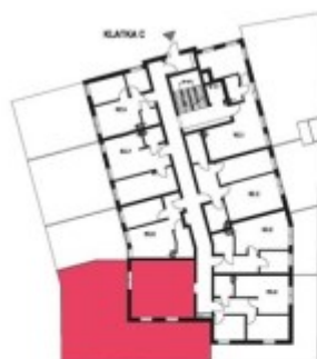
Schemat budynku klatka C PARTER