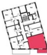
Schemat budynku klatka B 1 PIĘTRO