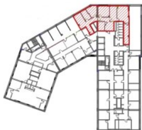
SZKIC ORIENTACYJNY - I PIĘTRO

słownie: sto dziewięćdziesiąt siedem mkw. i 04/100